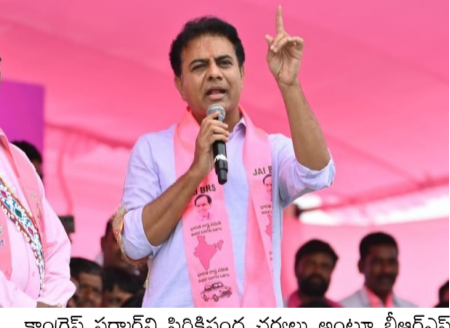
కాంగ్రెస్ సర్కార్ వి పిరికిపంద చర్యలు అంటూ బీఆర్ఎస్ నేతల అరెస్టులపై కేటీఆర్ మిగతా 2లో

యువత ఉద్యోగాలు సృష్టించే స్థాయికి ఎదగాలి కాంగ్రెస్ సర్కార్ వి పిరికిపంద చర్యలు ● కాంగ్రెస్ సర్కార్ వి పిరికిపంద చర్యలు అంటూ బీఆర్ఎస్ నేతల అరెస్టులపై కేటీఆర్ తీవ్ర స్థాయిలో మండిపడ్డారు. ● పరిగి నియోజకవర్గంలో తమ భూములను కాపాడుకోవడానికి పోరాడుతున్న రైతులకు మద్దతుగా వెళ్తున్న బీఆర్ఎస్ నేతలను అక్కడ గృహ నిర్బంధం చేయడం, అరెస్టులు చేయడంపై బీఆర్ఎస్ కార్యనిర్వాహక అధ్యక్షుడు కేటీఆర్ తీవ్రంగా ఖండించారు.