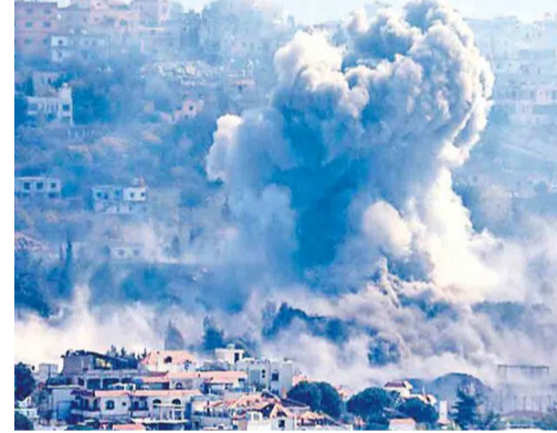
రిమాట్ కంట్రోల్ పేలుళ్లతో ఇండ్లు ధ్వంసం చేస్తున్న ఐడీఎఫ్ జెరూసలేం : సీట్పైర్ తర్వాత అమెరికా-ఇరాన్ మధ్య

దాడులు ఆగినా.. ఇజ్రాయెల్ మాత్రం లెబనాన్ ను పదిలిపెట్టడం లేదు. ముఖ్యంగా దక్షిణ లెబనాన్లోని మొత్తం గ్రామాలను ఒక క్రమ వర్ధిల్లం నామరూపాలేకుండా తుడిచిపెట్టేస్తుంది. బాంబులు, పేలుళ్లతో అక్కడను ఇండ్లు, భవనాలను కూల్చేస్తున్నది. దీనిపై 'గార్డయన్' కథనం ప్రకారం, ఇండ్లకు పేలుడు పదార్థాలను అమ్మి, వాటిని రిమాట్ కంట్రోల్ ద్వారా పేల్చేస్తున్నది. తెజ్, సఖోరా, దేరేసర్కాన్ సరిహద్దు గ్రామాల్లో సామాజిక పేలుడు జరుపుతున్నట్లు ఇజ్రాయెల్ సైన్యం మాడు మీడియాలు విడుదల చేసింది. దక్షిణ లెబనాన్ సరిహద్దు ప్రాంతాల్లో ఈ విధ్వంసం కొనసాగుతున్నట్లు మీడియాలో కథనాలు వెలువడ్డాయి. దక్షిణ లెబనాన్ పై శనివారం నాటి దాడుల్లో 18 మంది చనిపోయారు. లెబనాన్లో శాంతి చర్యలు, ఒప్పందం హెచ్చింపులకు వర్తించదని