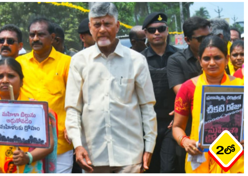
పార్లమెంటులో మహిళా రిజర్వేషన్ బిల్లును అడ్డుకోవడం ద్వారా కాంగ్రెస్ నేతృత్వంలోని విషయాల జాబితా ద్రోహం చేశాయని ముఖ్యమంత్రి చంద్రబాబు తీవ్రస్థాయిలో ధ్వజమెత్తారు. భారత ప్రజాస్వామ్య చరిత్రలో నిస్పృహి రోజు ఒక ఖాళీ డే అని ఆయన అభివర్ణించారు. - మిగతా 2 లో