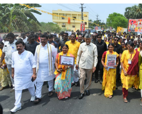
మెజారిటీ సభ్యుల మద్దతు రాకుండా కాంగ్రెస్, దాని మిత్రపక్షాలు కుట్రపూరితంగా అడ్డుకున్నాయి. ఆడబిడ్డలుంటే వివక్షలకు ఇంత చురుకైనా? అని ఆయన ప్రశ్నించారు. ఈ అంశంపై జనసేన అధినేత పవన్ కల్యాణ్ తో మాట్లాడాలని, ఎన్ని వక్షాలతో పాటు ఇతర పార్టీలు కూడా కలిసి రాజులని పిలుపునిచ్చారు. 2017లోనే డీటీపీ ప్రభుత్వం మహిళా రిజర్వేషన్ల కోసం అసెంబ్లీలో తీర్మానం

మొదటివేళ తరువాతి - మహిళా బిల్లును అడ్డుకున్న వివక్షాల వైఖరికి నిరసనగా తూర్పు గోదావరి జిల్లా నిడదవోలులో ఎన్ని ఏభాగస్వామ్య వక్షాలు శనివారం భారీ నిరసన రాల్చి చేపట్టాయి. ఈ రాల్చి అనంతరం చంద్రబాబు మీడియాతో మాట్లాడి, వివక్షాల తీరుపై తీవ్ర ఆగ్రహం వ్యక్తం చేశారు. "మహిళలకు చట్టపరమైన 33 శాతం రిజర్వేషన్లు కల్పించే సందర్భ కల సాకారం అవుతుందని దేశమంతా ఆశగా ఎదురుచూసింది. కానీ, కాంగ్రెస్ నాయకత్వంలోని ప్రతిపక్షాలు తమ సంకచిత రాజకీయ అజెండా కోసం ఈ చారిత్రక బిల్లును అడ్డుకుని దుర్మార్గానికి పాల్పడ్డాయి. ఎక్కడ స్త్రీలను పూజిస్తారో అక్కడ దేవతలుంటారని నమ్మే సంస్కృతి మనది. కానీ, పార్లమెంటులో అందుకు భిన్నంగా మహిళల ఆత్మాభిమానాన్ని దెబ్బతీశారు. దేశాభిమానం పోరాడుతున్న మహిళా రిజర్వేషన్లను అడ్డుకోవడం క్షమించరాని నేరం" అని చంద్రబాబు మండిపడ్డారు. ఈ బిల్లు ఆమోదం పొంది ఉంటే దక్షిణాదికి, చిన్న రాష్ట్రాలకు అన్యాయం జరగదని ప్రధానమంత్రి, హోంమంత్రి స్పష్టమైన హామీ ఇచ్చారని చంద్రబాబు గుర్తుచేశారు. "సీట్లు 50 శాతం మేర పెరుగుతాయని, ఆంధ్రప్రదేశ్ లో కూడా అదే స్థాయిలో సీట్లు పెరిగేవని స్పష్టంగా చెప్పారు. అయినప్పటికీ, ఉత్తరాదికి, దక్షిణాదికి అన్యాయం జరుగుతుండటా లేనిపోని సాకులు చెప్పి,