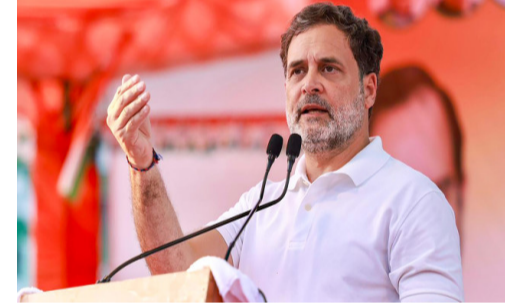
ప్రధాని నరేంద్ర మోదీపై కాంగ్రెస్ అగ్రనేత, లోక్ సభలో విపక్ష నాయకుడు రాహుల్ గాంధీ తీవ్రస్థాయిలో - మిగతా 2 లో