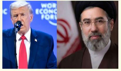
మధ్యప్రాంతంలో గత రెండు నెలలుగా కొనసాగుతున్న యుద్ధానికి ముగింపు పలికేందుకు ఇరాన్ చేసిన శాంతి ప్రతిపాదనను అమెరికా అధ్యక్షుడు డొనాల్డ్ ట్రంప్ తోసిపుచ్చారు. ఇరాన్ షరతులు 'హార్షా' - మిగతా 2 లో