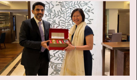
ఏపీ ఉత్పత్తులను ప్రపంచ మార్కెట్ కు చేర్చే లక్ష్యంతో రాష్ట్ర ప్రభుత్వం కీలక అడుగులువేస్తోంది. ఇందులో - మిగతా 2 లో