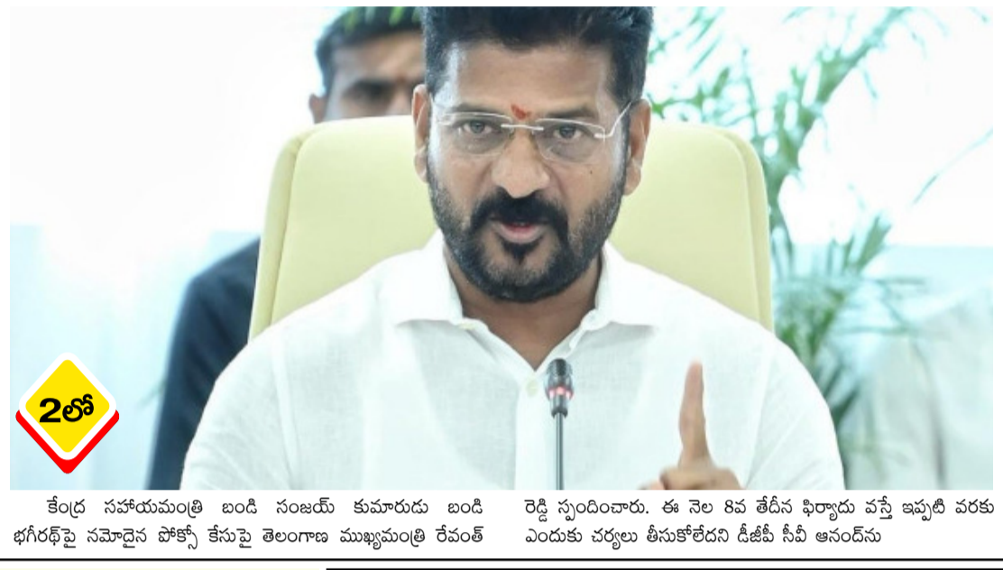
కేంద్ర సహాయమంత్రి బండి సంజయ్ కుమారుడు బండి రెడ్డి స్పందించారు. ఈ నెల 8వ తేదీన ఫిర్యాదు వస్తే ఇప్పటి వరకు భగీరథ్ పై నమోదైన పోక్సో కేసుపై తెలంగాణ ముఖ్యమంత్రి రేవంత్ ఎందుకు చర్యలు తీసుకోలేదని డీజీపీ సీవీ ఆనంద్ను