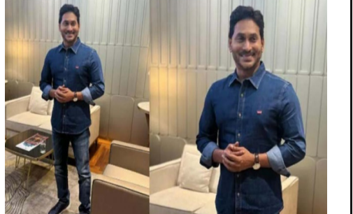
వైసీపీ అధినేత జగన్ తన విదేశీ పర్యటనను ముగించుకుని స్వదేశానికి చేరుకున్నారు. - మిగతా 2 లో