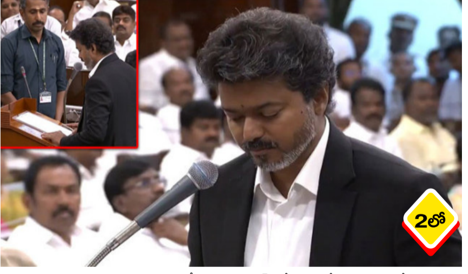
తమిళనాడు ముఖ్యమంత్రిగా నిన్ను ప్రమాణ స్వీకారం విజయ్, నేడు ఎమ్మెల్యేగా ప్రమాణం చేశారు. కొత్తగా చేసిన తమిళగ వెల్లి కళగం (టీవీకే) అధినేత సి. జోసెఫ్ ఏర్పాటైన 17వ తమిళనాడు అసెంబ్లీ