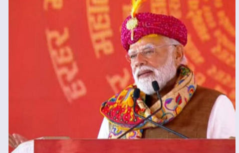
ప్రధాని నరేంద్ర మోదీ మరోసారి దేశ తొలి ప్రధాని జవహర్ లాల్ నెహ్రూపై తీవ్ర విమర్శలు చేశారు. స్వాతంత్ర్యానంతరం గుజరాత్ లోని - మిగతా 2 లో