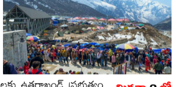
చార్ ధామ్ యాత్రకు వెళ్లే భక్తులు, మర్యాదకులకు ఉత్తరాఖండ్ ప్రభుత్వం - మిగతా 2 లో