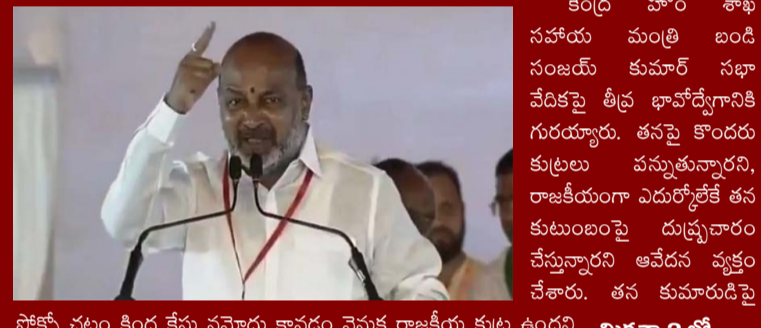
కేంద్ర హోం శాఖ సహాయ మంత్రి బండి సంజయ్ కుమార్ సభా వేదికపై తీవ్ర భాషోద్వేగానికి గురయ్యారు. తనపై కొందరు కుట్రలు పన్నుతున్నారని, రాజకీయంగా ఎదుర్కోలేకే తన కుటుంబంపై దుష్ప్రచారం చేస్తున్నారని ఆవేదన వ్యక్తం చేశారు. తన కుమారుడిపై పోక్సో వ్యవస్థం కింద కేసు నమోదు కావడం వెనుక రాజకీయ కుట్ర ఉందని - మిగతా 2 లో