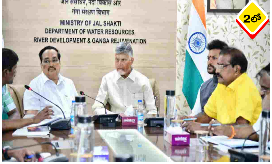
పలువురు కేంద్ర మంత్రులు, ఉన్నతాధికారులతో వరుస భేటీలు అయ్యాయి. తొలుత పార్టీ ఎంపీలతో