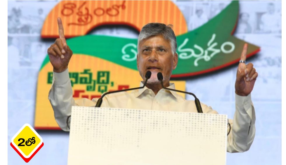
తిరుపతి వేదికగా తెలుగుదేశం, జనసేన, బీజేపీ కూటమి (ఎన్డీపీ) ప్రభుత్వం 'రెండేళ్ల సమృతం- అభివృద్ధి, సంక్షేమం' పేరిట భారీ బహిరంగ సభను నిర్వహించింది. ఈ సభకు ముఖ్యమంత్రి చంద్రబాబు, ఉప

తిరుపతి సభలో చంద్రబాబు తిరుపతిలో 'రెండేళ్ల సమృతం- అభివృద్ధి, సంక్షేమం' సభలో పాల్గొన్న సీఎం చంద్రబాబు గత ఐదేళ్ల పాలన రాష్ట్రాన్ని విధ్వంసం చేసిందని, ఎన్ని ఏ ప్రభుత్వం రాష్ట్రాన్ని గాడిలో పెడుతోందని వ్యాఖ్య సంక్షేమ పథకాలు, అభివృద్ధి కార్యక్రమాలు, పెట్టుబడుల గురించి వివరించిన ముఖ్యమంత్రి ప్రధాని మోదీ నాయకత్వాన్ని, కేంద్ర ప్రభుత్వ సహకారాన్ని కొనియాడిన చంద్రబాబు స్వర్ణాంధ్ర 2047 లక్ష్యంగా, మూడు ప్రాంతాల సమగ్రాభివృద్ధికి కట్టుబడి ఉన్నామని స్పష్టీకరణ