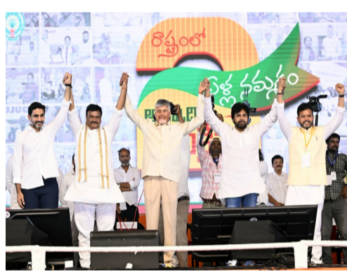
మొదటిపేజీ తరువాయి - ముఖ్యమంత్రి పవన్ కల్యాణ్, మంత్రి నారా లోకేశ్, కేంద్ర మంత్రులు కింజర్ల శ్రీకాంత్, రామ్మోహన్ నాయుడు, సెమ్మసాని చంద్రభాగవత్, ఏపీ బీజేపీ చీఫ్ పీవీఎస్ మోహన్ పాటు పలువురు మంత్రులు, ఎమ్మెల్యేలు, ఎంపీలు, ఎన్టీసీ కుటుంబ నేతలు హాజరయ్యారు. ఈ సందర్భంగా ముఖ్యమంత్రి చంద్రబాబు సుదీర్ఘ ప్రసంగాన్ని చేసి, రిండెజ్ పాలనలో ప్రభుత్వం చేపట్టిన ప్రగతిని, భవిష్యత్ ప్రణాళికలను ప్రజల ముందుంచారు. తన రాజకీయ ప్రస్థానం మొదలైన తరువాత, ఏడుకొండలస్వామి చెంతన ఈ కార్యక్రమం జరగడం సంతోషంగా ఉందని, ఇది తనకు పునర్జన్మ లాంటిదని ఆయన వ్యాఖ్యానించారు.

దానిని కూడా వాడుకోలేని దుస్థితిలో గత ప్రభుత్వం ఉందని విమర్శించారు. తనతో పాటు పవన్ కల్యాణ్ ను కూడా అదుగదుగునా వేధించాలని, ఎలాంటి చోటిను ప్రస్తావించారూ, ఎన్టీసీ భరోసా కింద పెన్షన్లను రూ.4,000కు పెంచి, 63 లక్షల మందికి అందిస్తున్నామని, ఇది ప్రపంచంలోనే అతిపెద్ద సంక్షేమ కార్యక్రమమని అన్నారు. ‘శక్తి వందన’ ద్వారా ఎంతమందికి పిల్లలుంటే అంతమందికి ఏటా రూ.15,000 ఇస్తున్నామని, ‘శ్రీకృష్ణ’ పథకం ద్వారా మహిళలకు ఉచిత బస్సు ప్రయాణం కల్పించగా, ఇటీవలే 71 కోట్ల మంది ప్రయాణించారని వెల్లడించారు. ‘ఓం’ కింద మూడు ఉచిత గ్యాస్ సిలిండర్లు, ‘అన్నదాత సుఖీభవ’ కింద రైతులకు ఏటా రూ.20,000 అందిస్తున్నామని వివరించారు. వీటితో పాటు గత కాలకు, వడ్డెత్తు, నాయి శ్రావ్యాలు, పాస్టర్లు, ఇమామలు తదితర అన్ని వర్గాల సంక్షేమానికి కట్టుబడి ఉన్నామని స్పష్టం చేశారు.