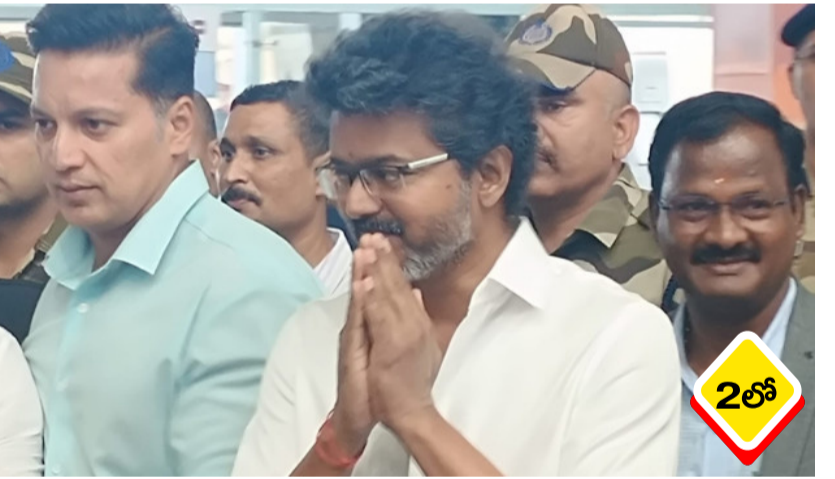
తమిళనాడు ముఖ్యమంత్రి విజయ్ కుక్కవారం నాడు కొల్లూరులోని ఉదుపి జిల్లాలో వెలసిన ప్రసిద్ధ పుణ్యక్షేత్రం కొల్లూరు మూకాంబికా అలయాన్ని సందర్శించారు. ఈ సందర్భంగా అమ్మవారికి ప్రత్యేక పూజలు నిర్వహించిన ఆయన, తన మొక్కులో భాగంగా 1.6 కిలోల బరువున్న వెండి ఖడ్గాన్ని కానుకగా సమర్పించారు. తమిళనాడు వెత్రి కళగం (టీవీకే) పార్టీ తరఫున విజయం సాధించి, నే నెలలో ముఖ్యమంత్రిగా బాధ్యతలు స్వీకరించిన తర్వాత విజయ్ రాష్ట్రం వెలువల పర్యటించడం ఇదే తొలిసారి. ఢిల్లీ నుంచి విమానంలో మంగళూరు అంతర్జాతీయ విమానాశ్రయానికి చేరుకున్న ఆయన, అక్కడి నుంచి రోడ్డు మార్గంలో సుమారు 125 కిలోమీటర్ల దూరంలోని అలయానికి చేరుకున్నారు. సంప్రదాయ వస్త్రధారణలో వచ్చిన విజయ్ కు ఆలయ అధికారులు పూజకుంభంతో ఘన స్వాగతం

ఎంజీఆర్, జయ బాటలో సీఎం విజయ్.. కొల్లూరు మూకాంబిక అమ్మవారికి వెండి కత్తి సమర్పణ అలయానికి 1.6 కిలోల వెండి ఖడ్గాన్ని కానుకగా సమర్పణ ముఖ్యమంత్రిగా బాధ్యతలు స్వీకరించాక ఇదే ఆయన తొలి రాష్ట్రేతర పర్యటన గతంలో ఎంజీఆర్, జయలలిత కూడా ఇదే అలయాన్ని సందర్శించారు ఈ పర్యటన పూర్తిగా ఆధ్యాత్మికమైనదేనన్న అధికారులు